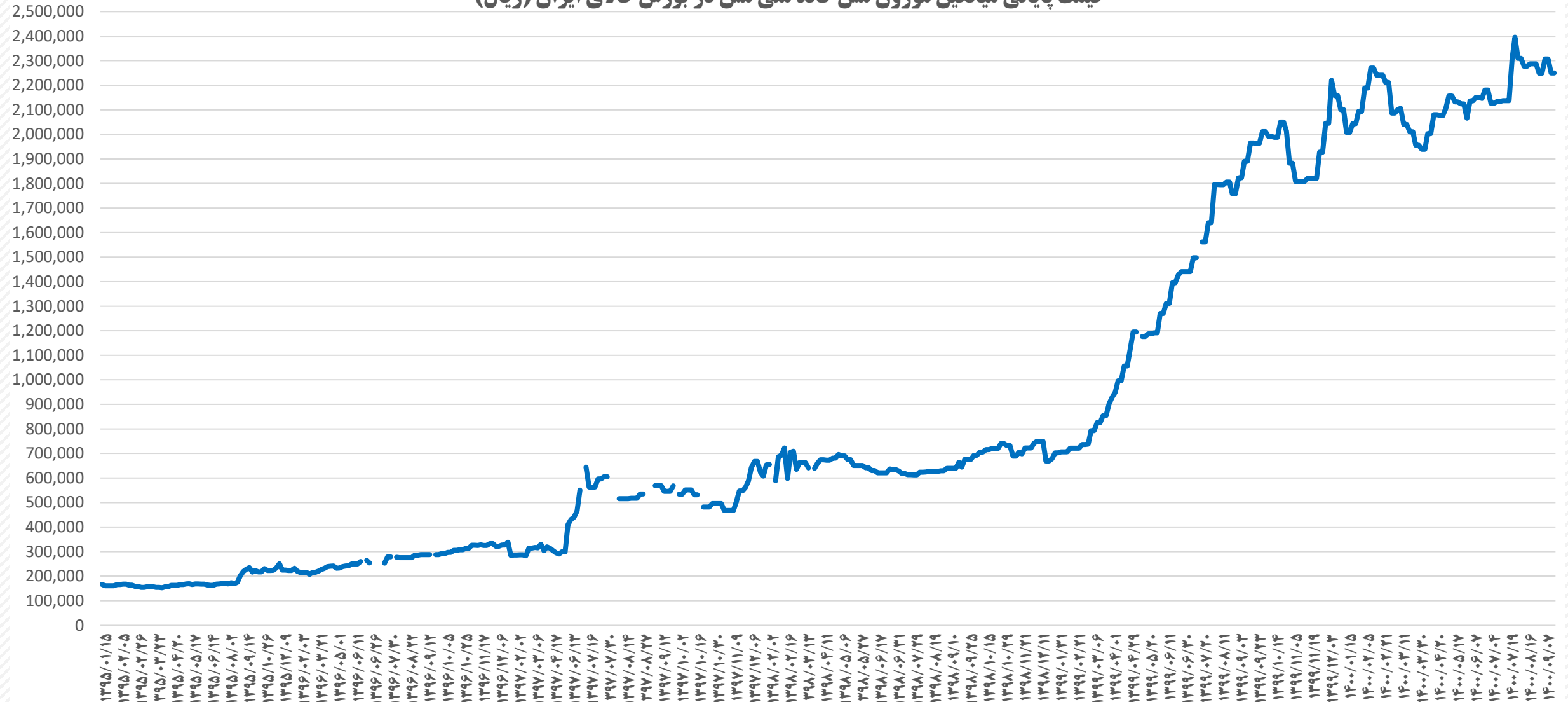
قیمت پایانی میانگین موزون مس کاتد ملی مس در بورس کالای ایران (ریال)